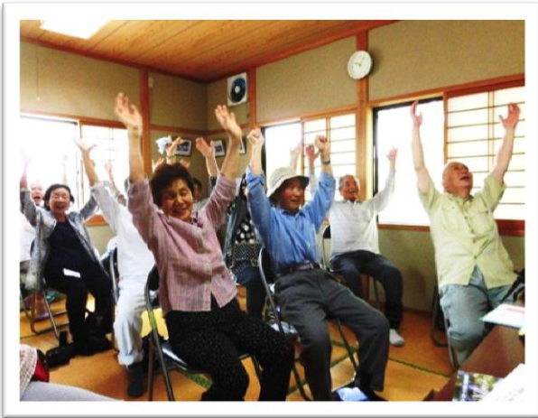
大津野学区 サロン・なかよし