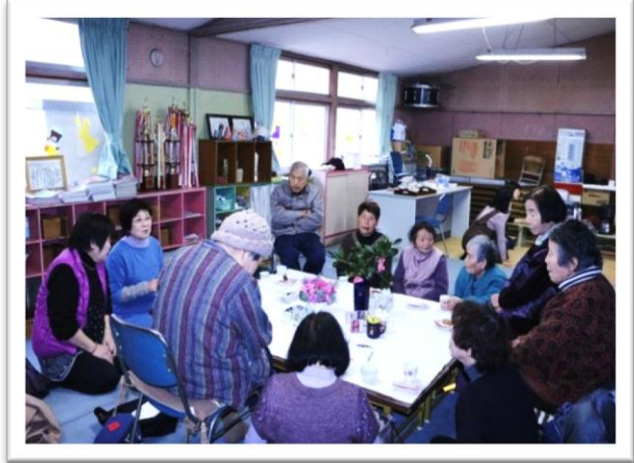
中条学区 ひだまりサロン