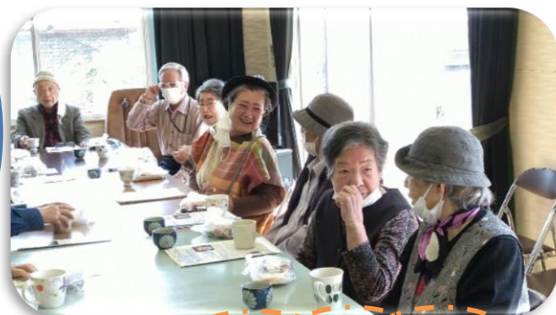
ふれあいいきいきサロン