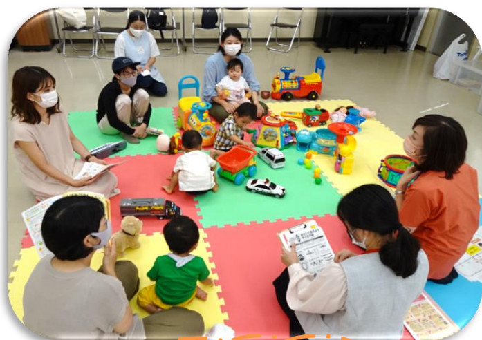
おもちゃサロン (子育て支援活動)