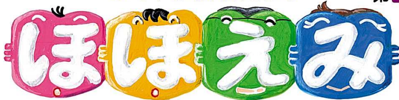
題字イラストは松岡恵子さん