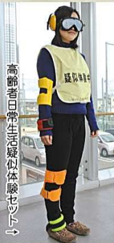
高齢者日常生活疑似体験セット