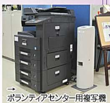
ボランティアセンター用複写機