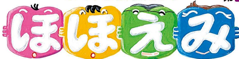
題字イラストは松岡恵子さん