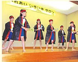
ふれあい・いきいきサロン

学区の福祉を高める会は、会員のボランティアコーディネーターとボランティア9人、町連会長、老人会長と公民館のスタッフにより活動しています。