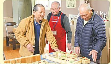
川口ふれあいサロン(川口学区)