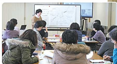
2015年度 福山市市民後見人養成講座

社協は、市民後見人活動が地域における権利擁護の担い手として定着するよう、引き続きサポートしてまいります。