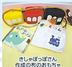
きしゃぼんぼさん 作成の布のおもちゃ