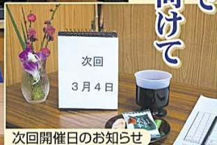
次回開催日のお知らせ