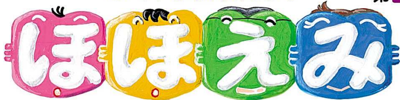
題字イラストは松岡恵子さん