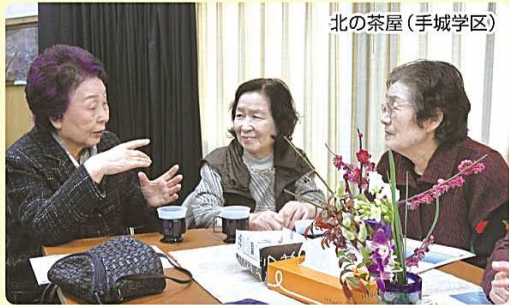
北の茶屋(手城学区)