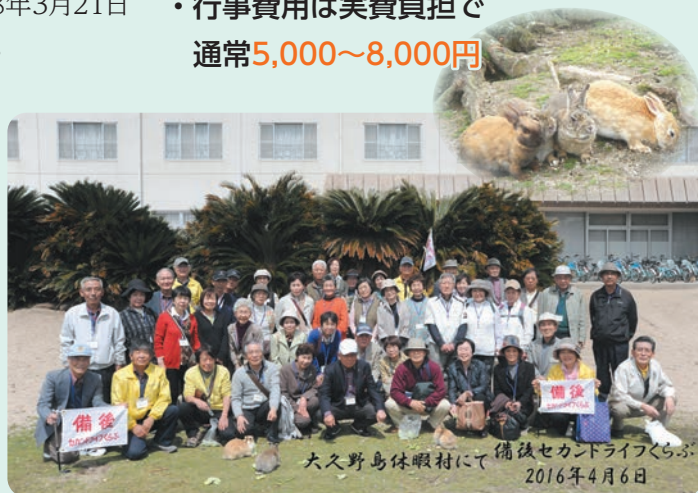
大久野島休暇村にて 備後セカンドライフくらぶ 2016年4月6日