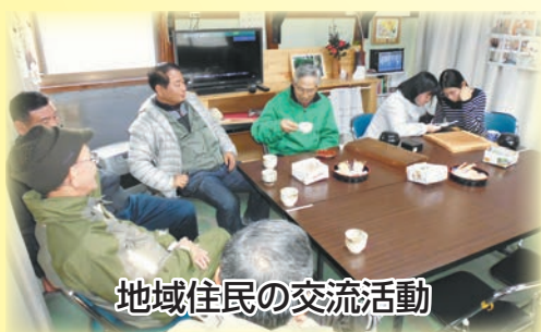
地域住民の交流活動