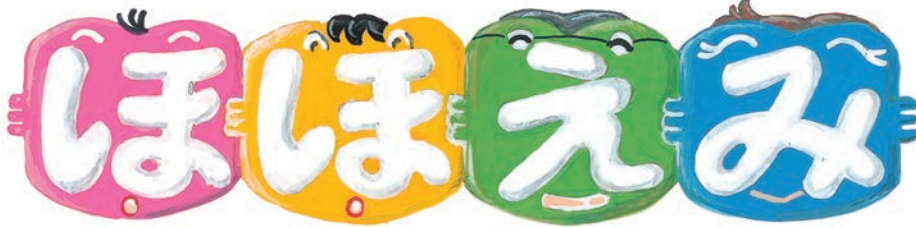
題字イラストは松岡恵子さん