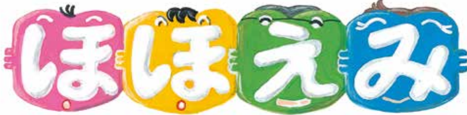
題字イラストは松岡恵子さん