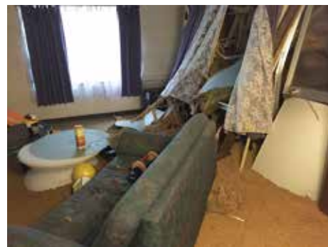
土砂が部屋の中まで