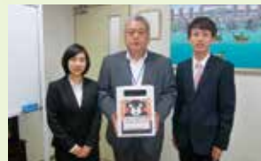
市立大学(学生会)様