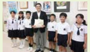
旭小学校(児童会)様