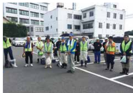
ボランティア出発式