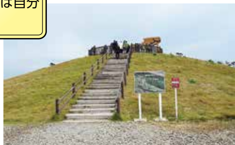
復興の象徴「千年希望の丘」(岩沼市) 震災廃棄物を土台にし、「人々の想いが人々を守る人口防潮丘」