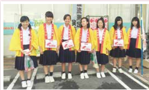
松永中学校の19名の生徒のみなさんのご協力もいただきました。