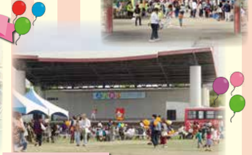
ふれあいステージ