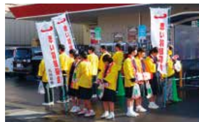
歳末たすけあい街頭募金(12/23)

【問い合わせ先】福山市共同募金委員会(事務局:社協 福祉サービス課) 電話 (084)928-1334 FAX (084)928-1331