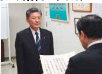
社協橋本会長から表彰状伝達