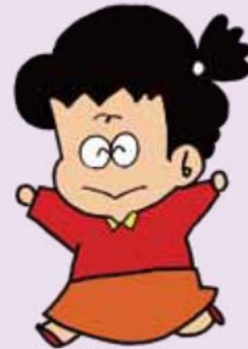
社協イメージキャラクター ふれあいマーちゃん

介護保険等の事業所運営においては、収支均衡を保つことが困難な状況となり、今後は 要介護認定調査業務に特化 した体制へ移行し、継続して公的法人としての役割を果たしてまいります。