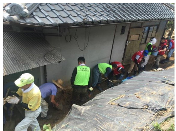
広島市・北広島市・庄原市・世羅町からも参加