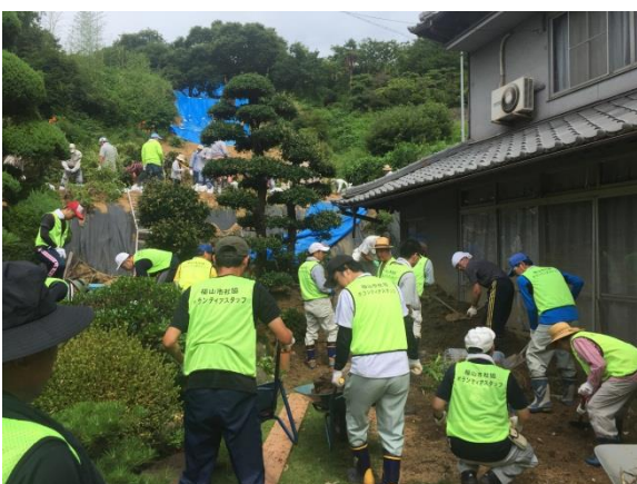
自治会などの地域団体と一緒に