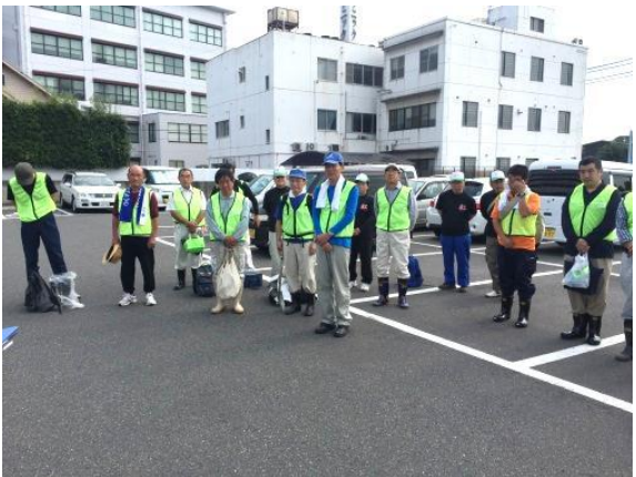
ボランティア出発式