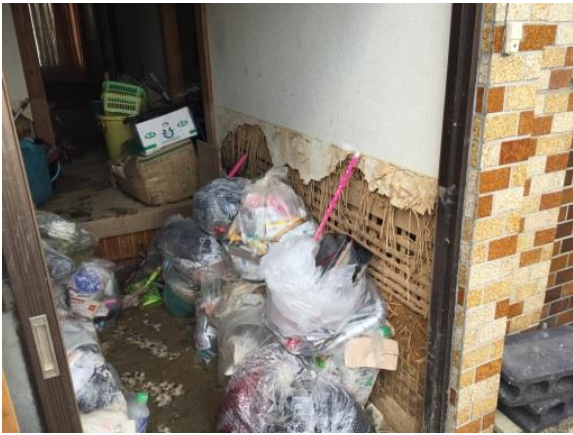
1階全部が床上浸水