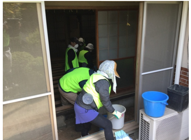
～土砂をバケツリレーでかきだします！～