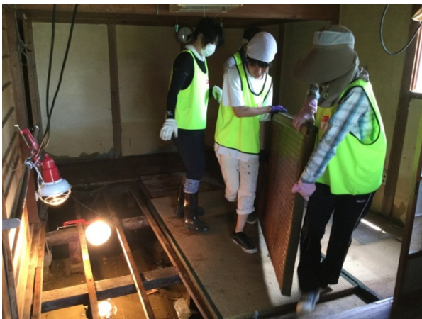
～みんなの力で畳あげ！～