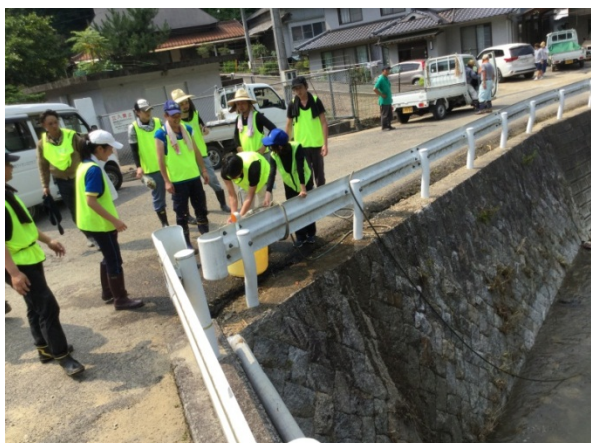
～地元の方々が清流をポンプでくみ上げていただきボランティアの皆で涼をとることができました！～