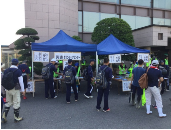
～災害ボランティアの受付～