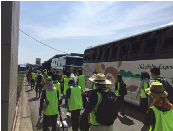
～バスに乗車後、移動～