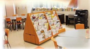
掲示板・パンフレットラック→