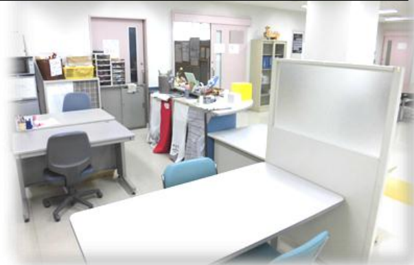
↑アドバイザーさんによる相談コーナー

上記のスペースは、登録のないボランティア団体・個人でも利用できますが、定期的利用される場合は登録してください。登録した場合、次の各部屋やスペースをご利用いただけます。