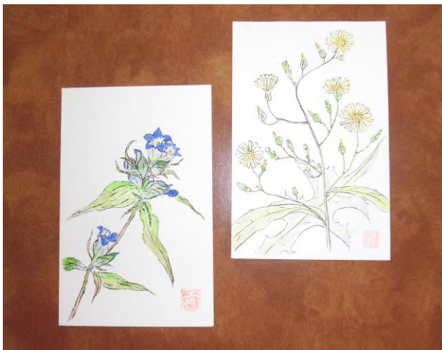
左「リンドウ」右「アキノノゲシ」